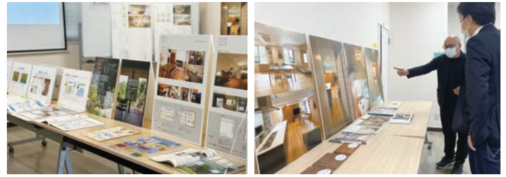
写真は過去開催のもの