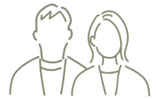
60代ご夫婦(柏市在住)

デザイン性があるリフォームに興味がありましたが、建築家に対しては「敷居が高い」というイメージを持っていました…。相談会では実際に建築家からのお話を聞けたので、イメージが変わりました。また、R+リノベの打ち合わせは、建築家との間に住宅会社がワンクッション入ってくれる点に魅力を感じました。